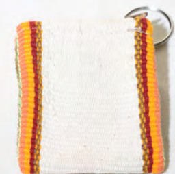
Monedero 18 Bs.