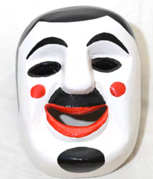
Careta 88 Bs.