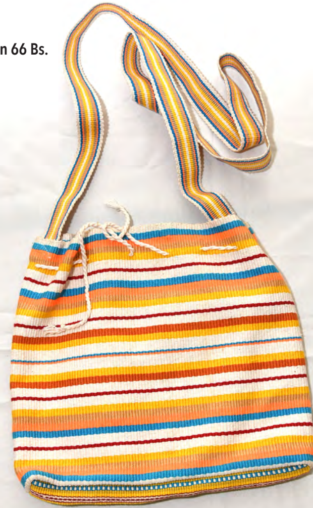
Bolsón 66 Bs.