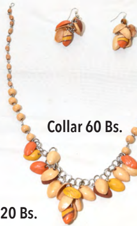
Collar 60 Bs.