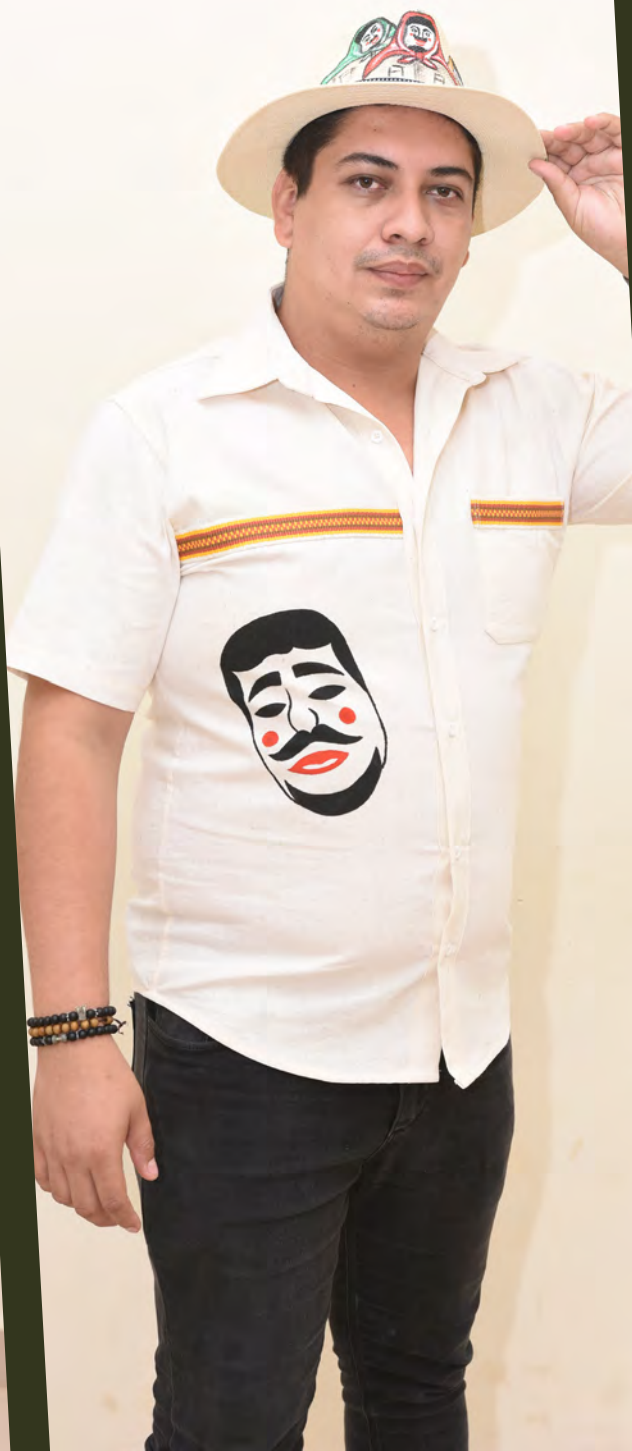
Camisa 132 Bs.