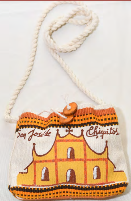
Bolsón 40 Bs.