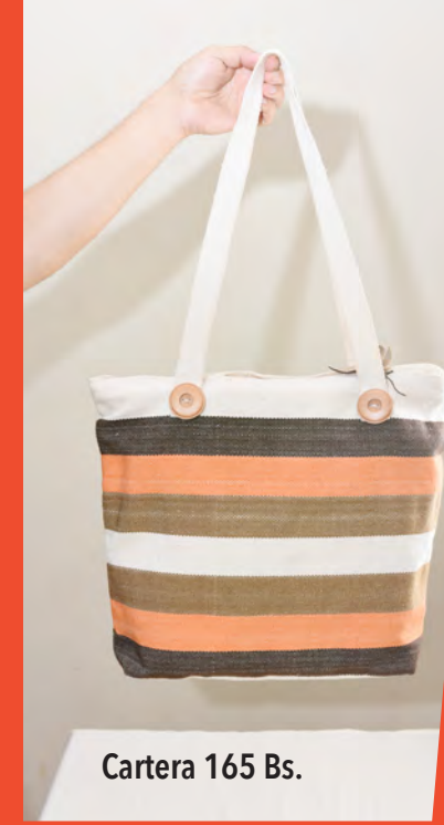
Cartera 165 Bs.