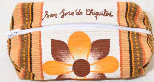
Porta lápiz 50 Bs.