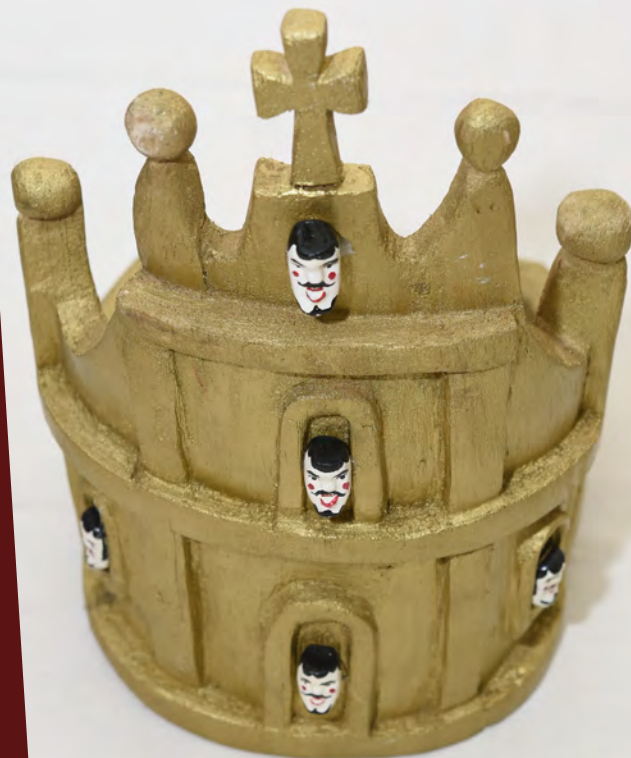
Corona de reina 600 Bs.