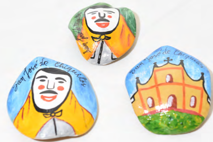
Imanes 25 Bs.