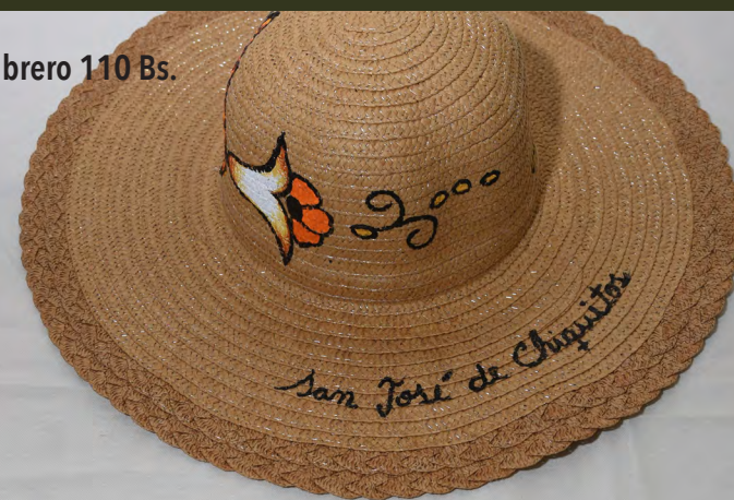
Sombrero 110 Bs.