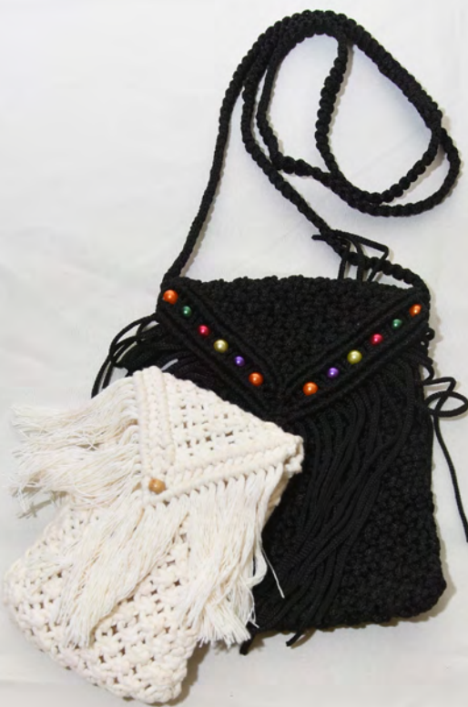
Carteras 77 Bs.