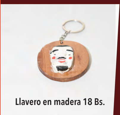
Llavero en madera 18 Bs.

Productos tejidos Tejidos en telar barroco chiquitano Tejidos en garabata ayoreo Tejidos en telar pintados