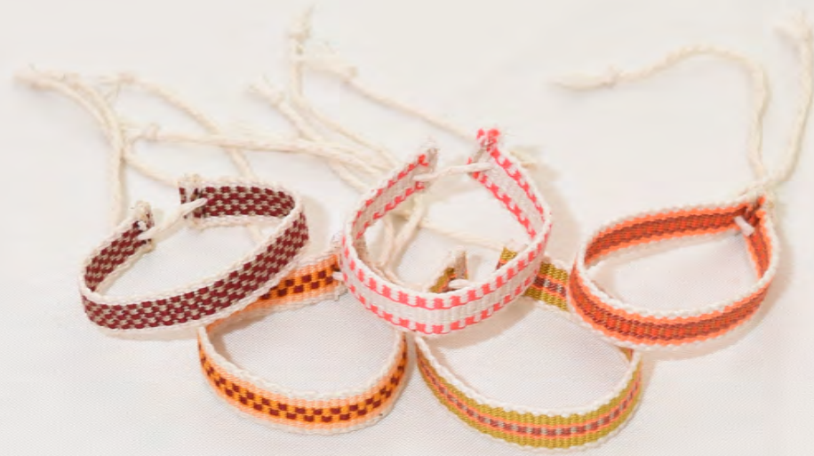
Manillas 15 Bs.