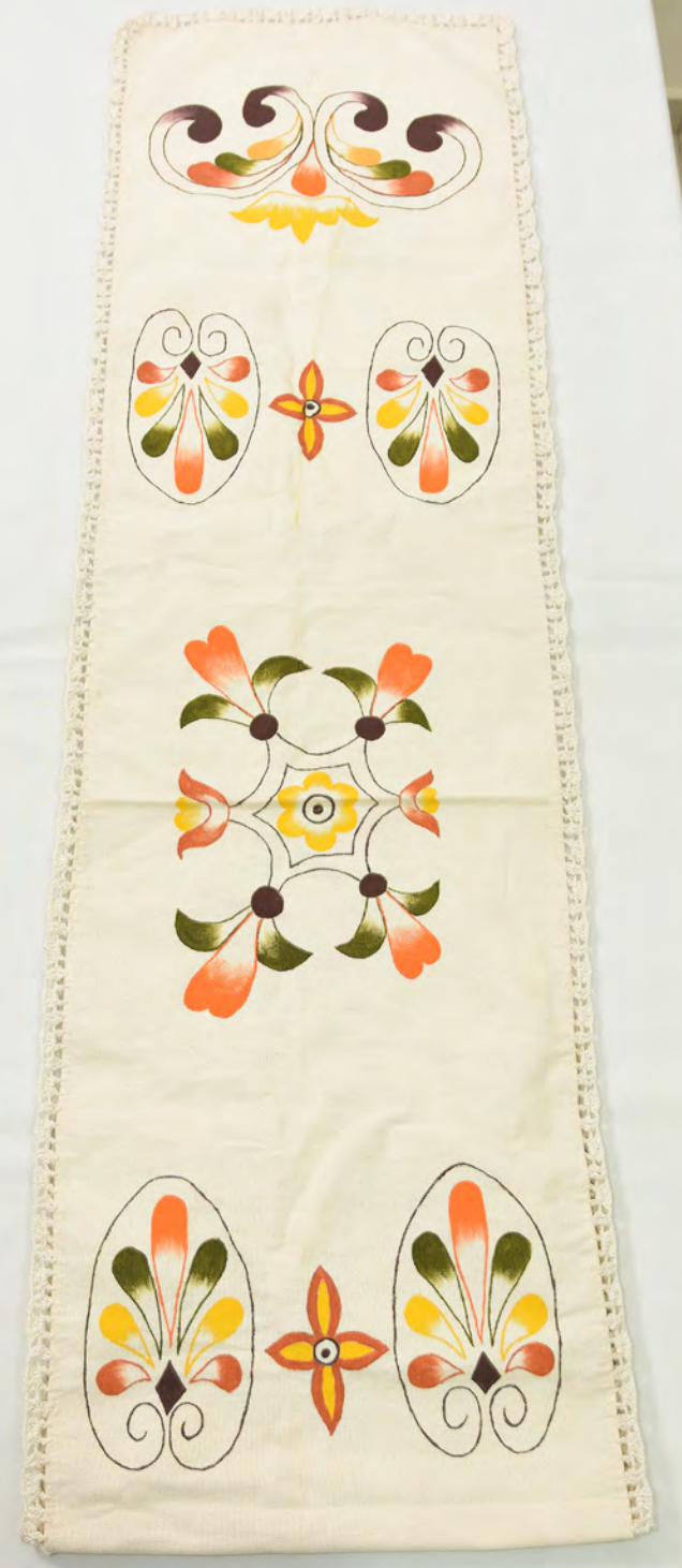
Camino de mesa 135 Bs.