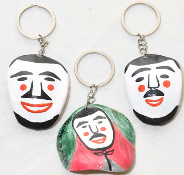
Llavero 15 Bs.