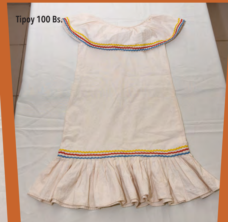
Tipoy 100 Bs.