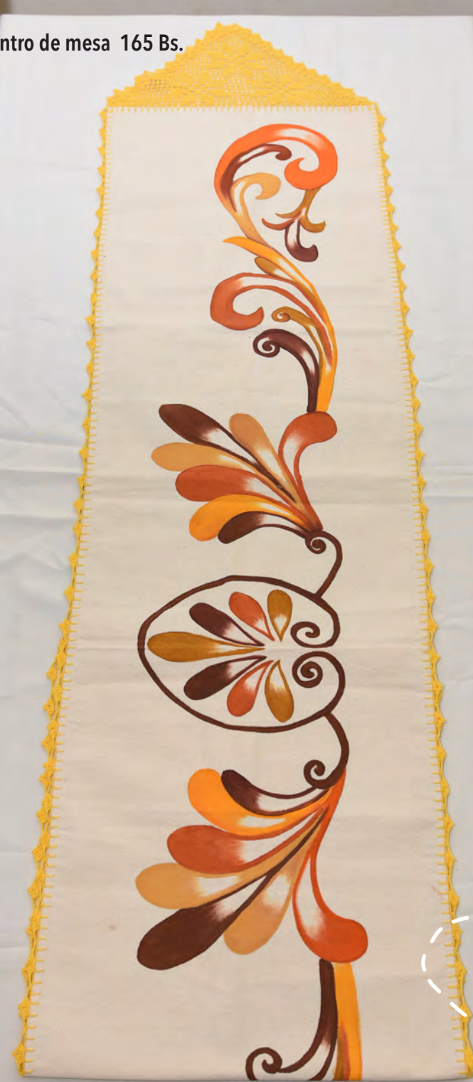
Centro de mesa 165 Bs.