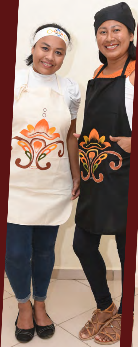
Mandiles 110 Bs. Gorro 22 Bs.