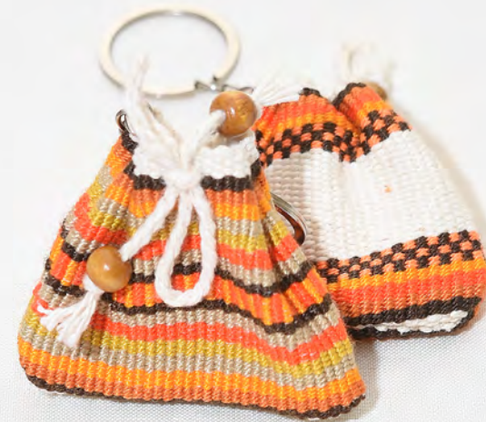
Llavero tejido 15 Bs.