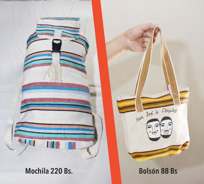
Mochila 220 Bs.