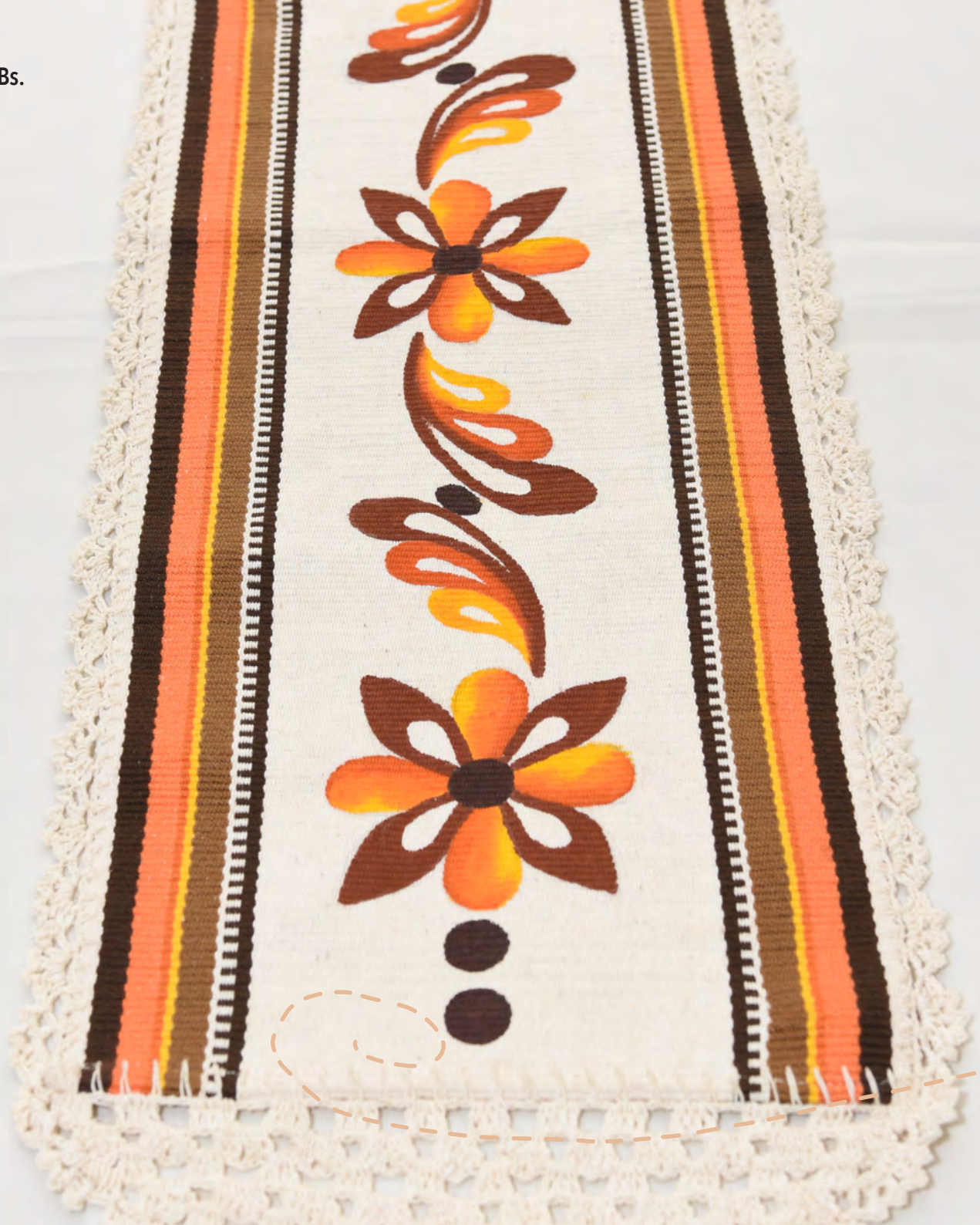
Camino de mesa 165 Bs.