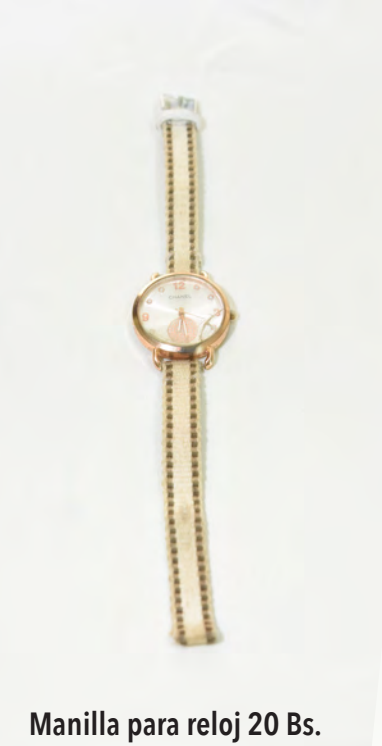
Manilla para reloj 20 Bs.