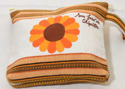
Porta cosmético 60 Bs