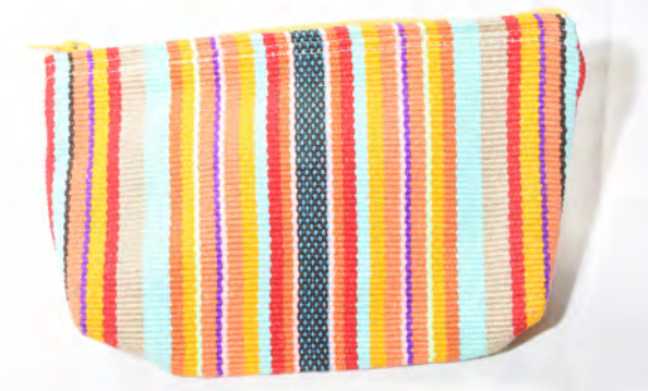
Estuchera 45 Bs.