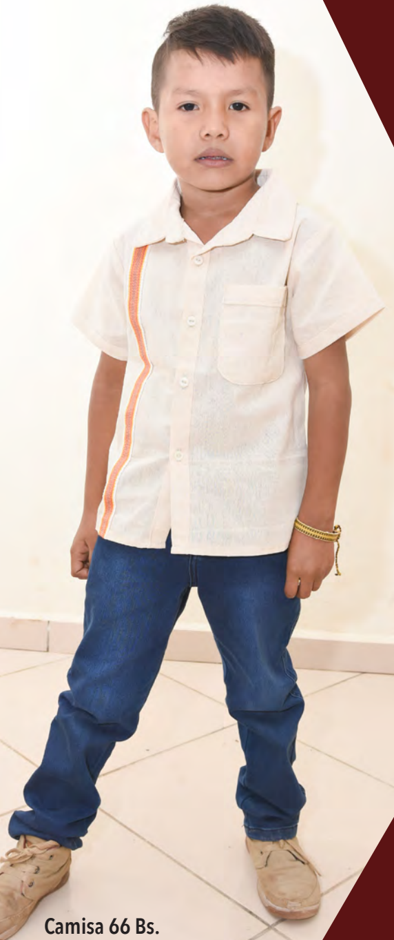
Camisa 66 Bs.