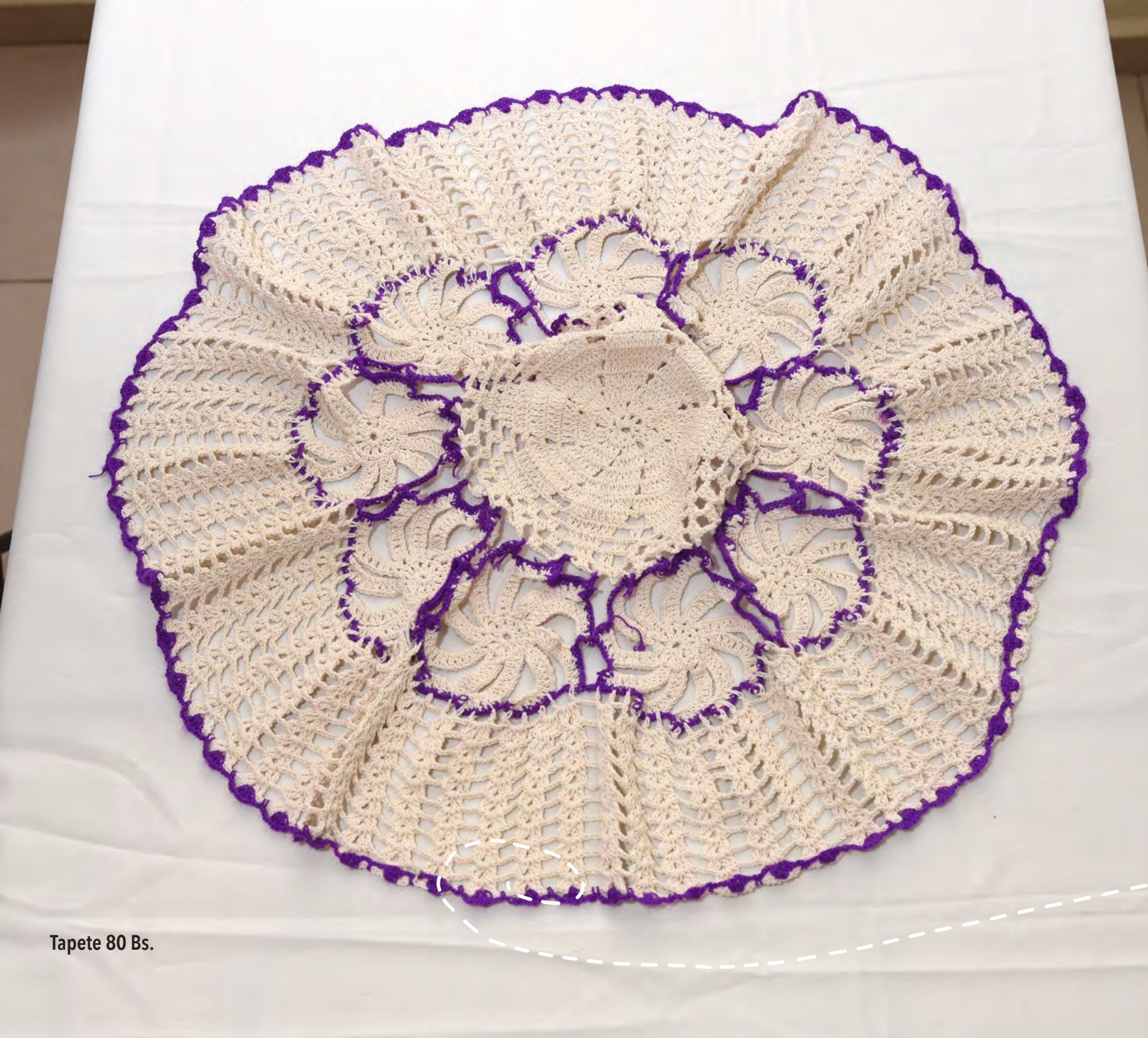
Tapete 80 Bs.