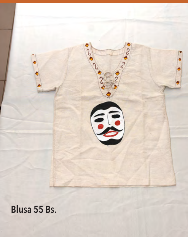
Blusa 55 Bs.