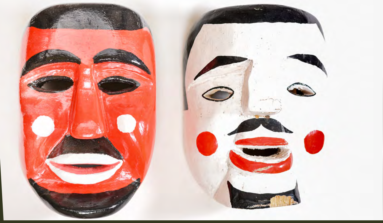
Máscaras 50 - 330 Bs.