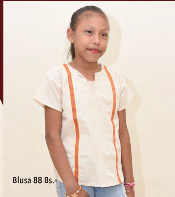
Blusa 88 Bs.