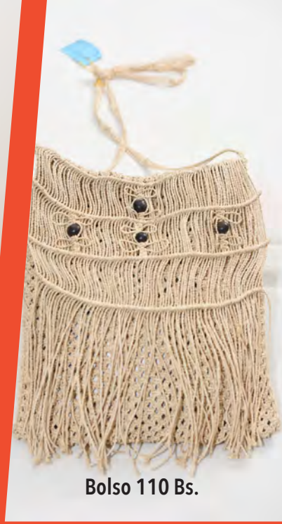
Bolso 110 Bs.