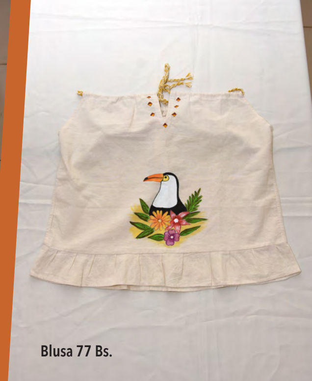
Blusa 77 Bs.