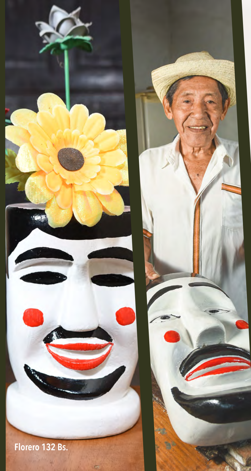
Florero 132 Bs.