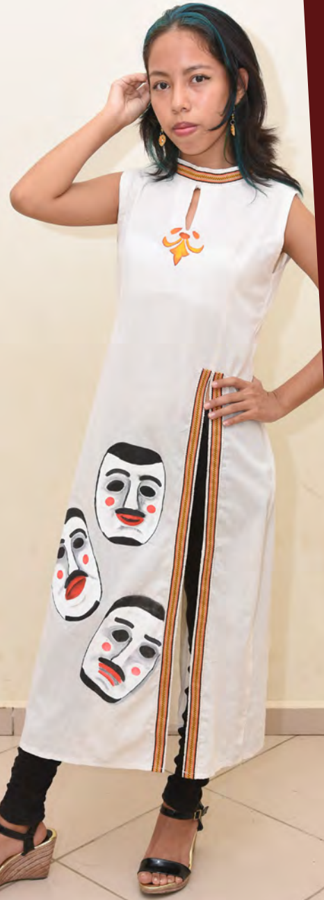
Blusa 176 Bs.