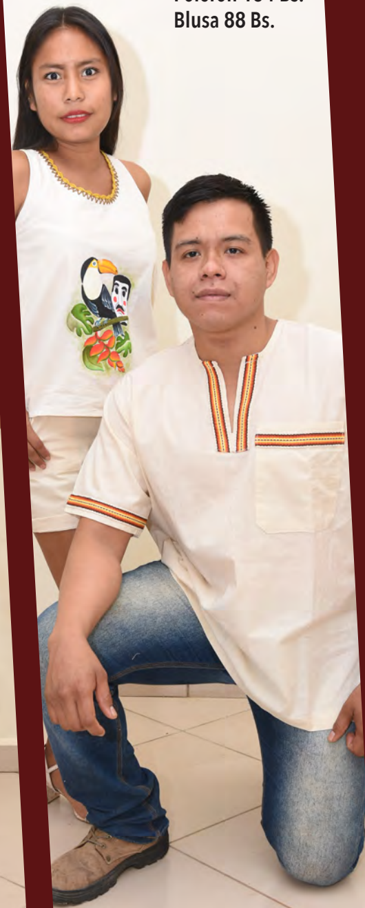
Polerón 154 Bs. Blusa 88 Bs.