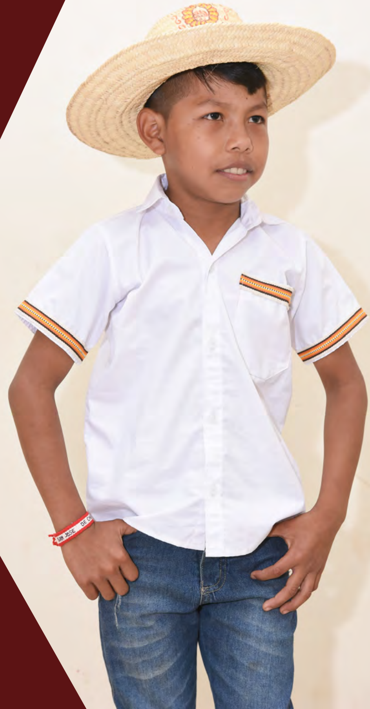
Camisa 90 Bs. Sombrero 90 Bs.