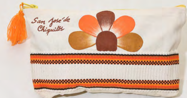
Porta cosmético 45 Bs.