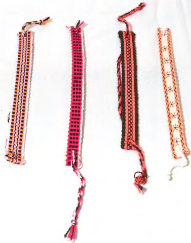
Manillas 15 Bs.