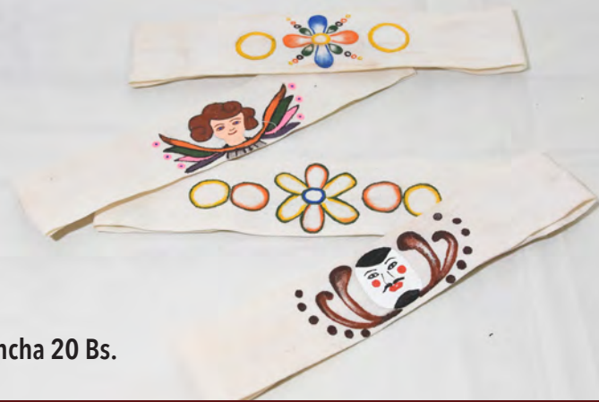
Vincha 20 Bs.