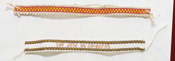
Manillas 15 Bs.