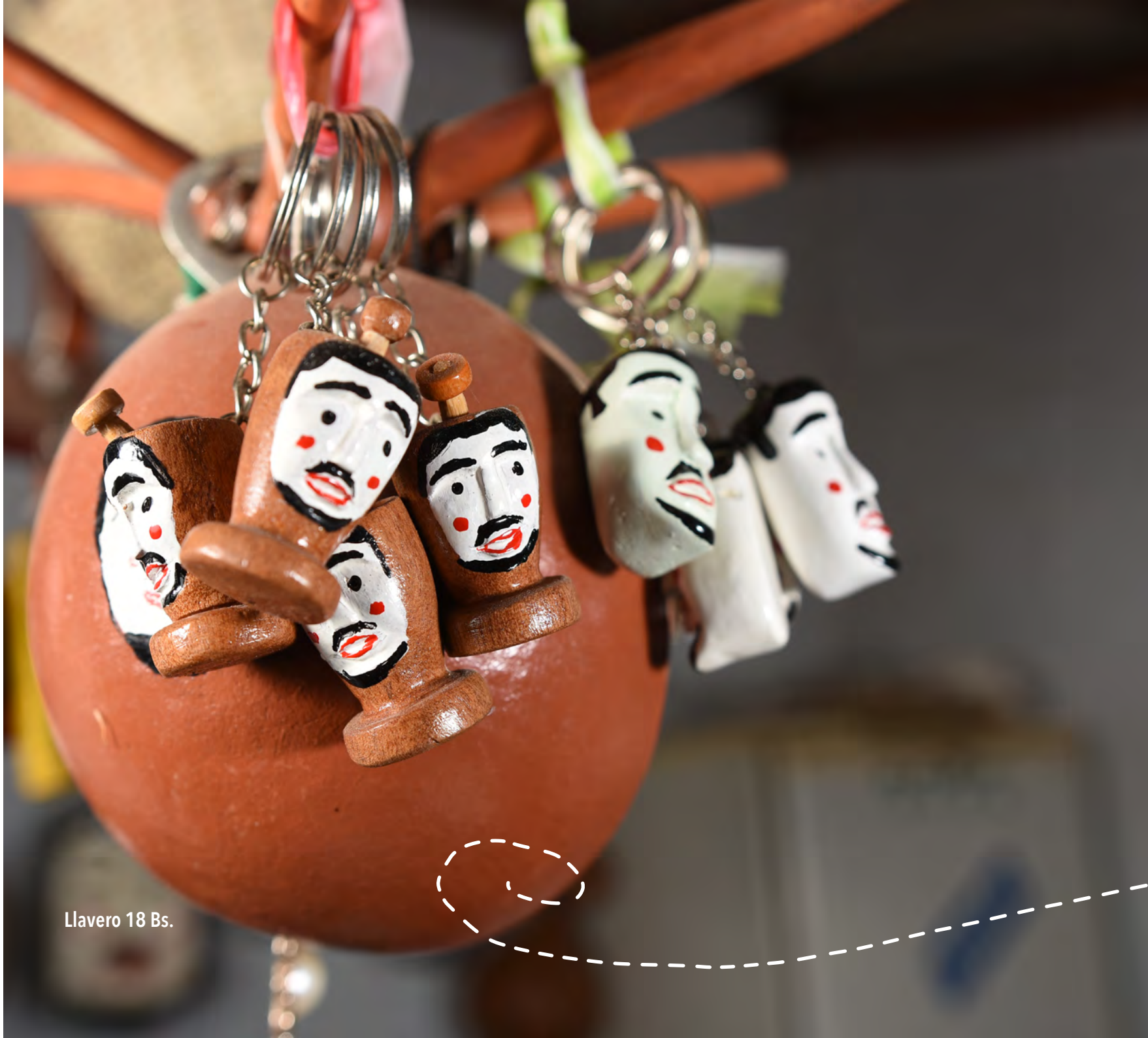
Llavero 18 Bs.