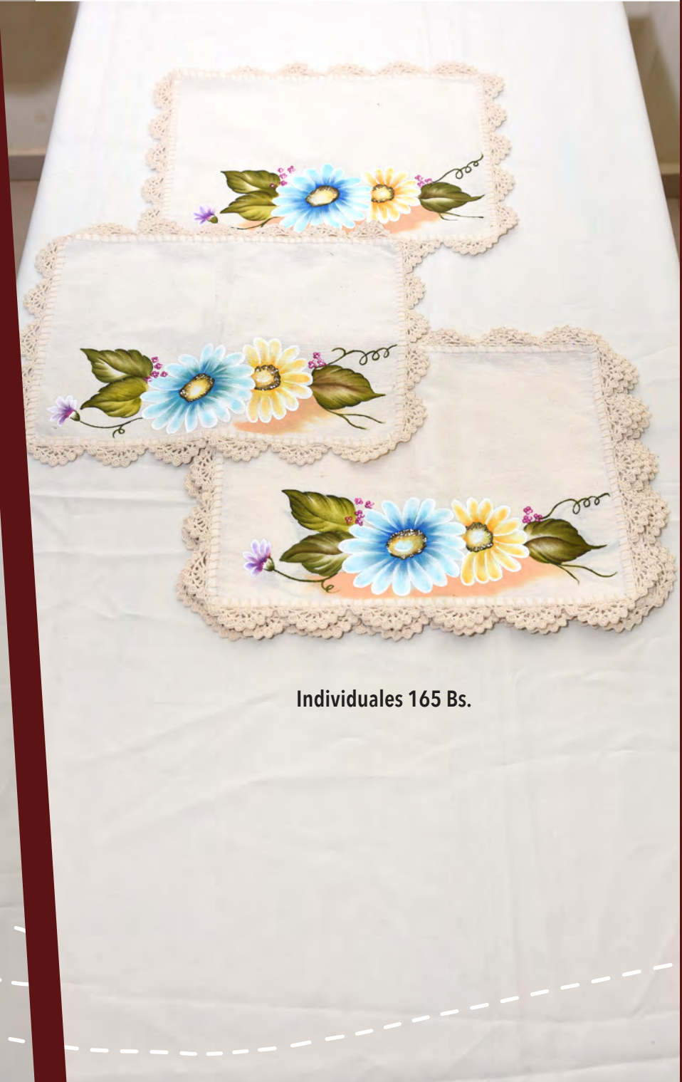
Individuales 165 Bs.