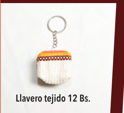
Llavero tejido 12 Bs.