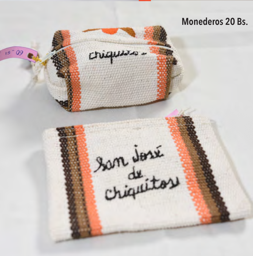
Monederos 20 Bs.