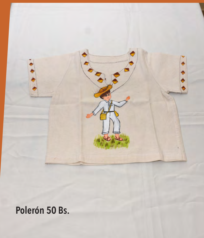
Polerón 50 Bs.