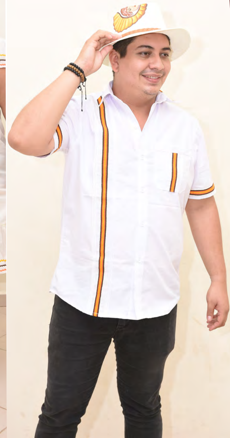
Camisa 165 Bs.