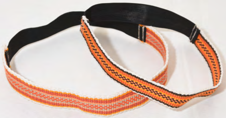
Vincha 20 Bs