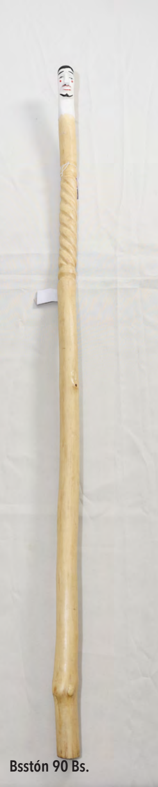
Bsstón 90 Bs.