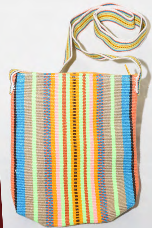
Morral 55 Bs.